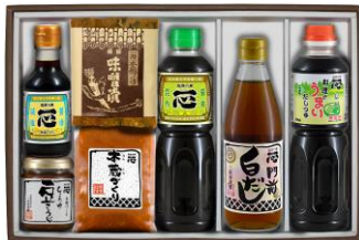
妙高高原 3,800 円+税