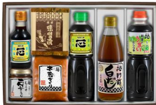
妙高高原 3,800 円+税