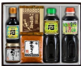
黒姫高原 3,300 円+税