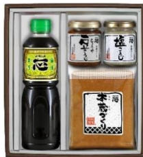
飯縄高原 2,500 円+税