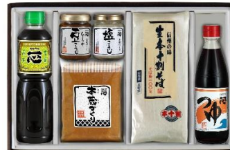
戸隠高原 そば 4 食分の場合 4,200 円+税